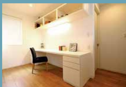
家族みんなが書斎としても使えるフリースペース