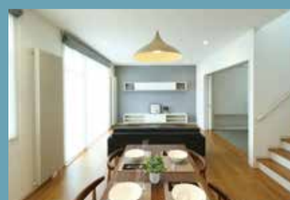
のびのびと暮らせる解放感のある高天井設計