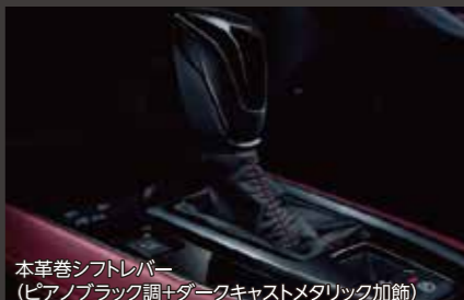
本革巻シフトレバー(ピアノブラック調+ダークメタリック加飾)