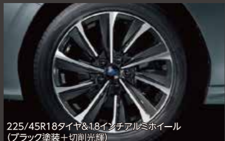
225/45R18タイヤ&18インチアルミホイール(ブラック塗装+切削光輝)