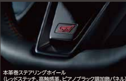
本革巻ステアリングホイール(レッドステッチ、高触感革、ピアノブラック調+ダークメタリック加飾)