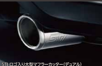
STI ロゴ入り大型マフラーカッター(デュアル)