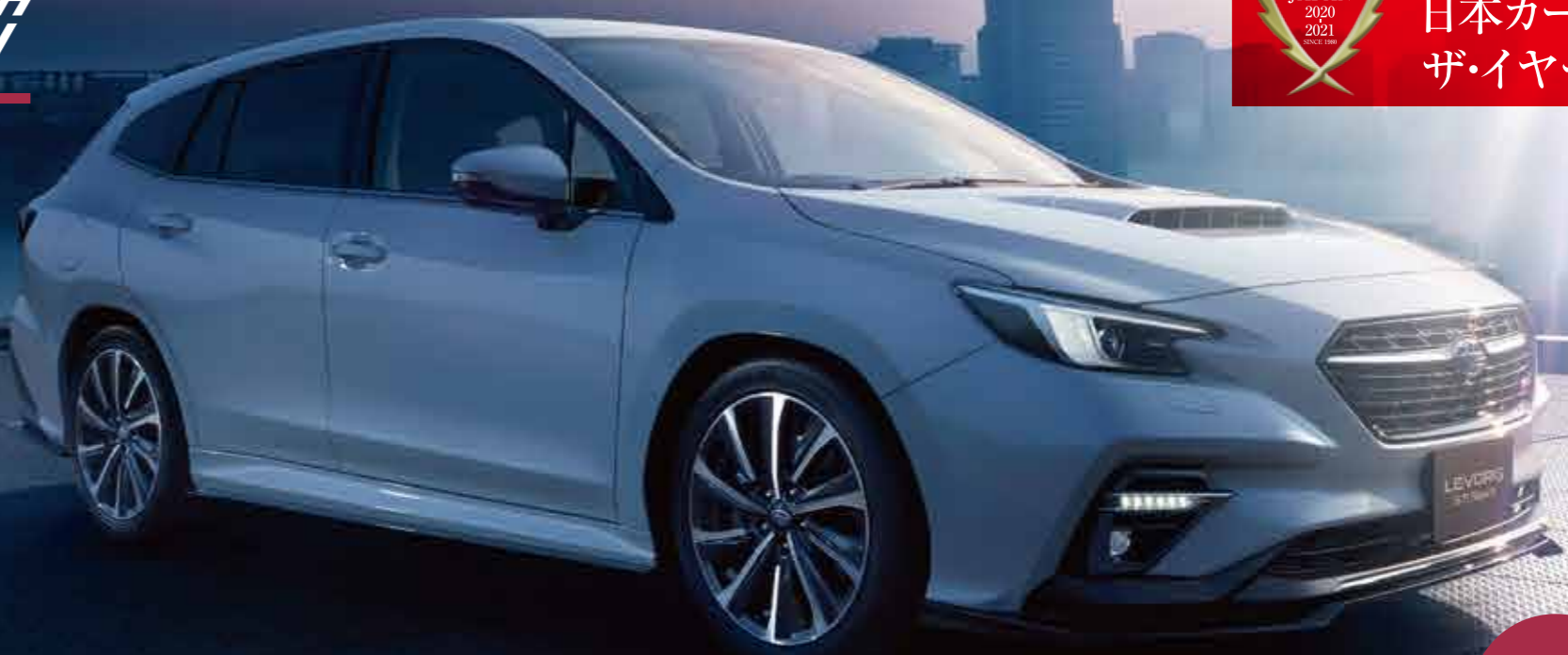
PHOTO:STI Sport EX クリスタルホワイトパール(33,000円高・消費税10%込)スマートリヤビューミラーはメーカー装着オプション LEDアクセサリライナー、STIフロントアンダースポイラー、STIサイドアンダースポイラー、STIリアサイドアンダースポイラー、STIリアアンダースポイラーはディーラー装着オプション 写真はすべてイメージです。