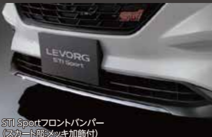
STI Sportフロントバンパー(スカパー下部※は加飾付)