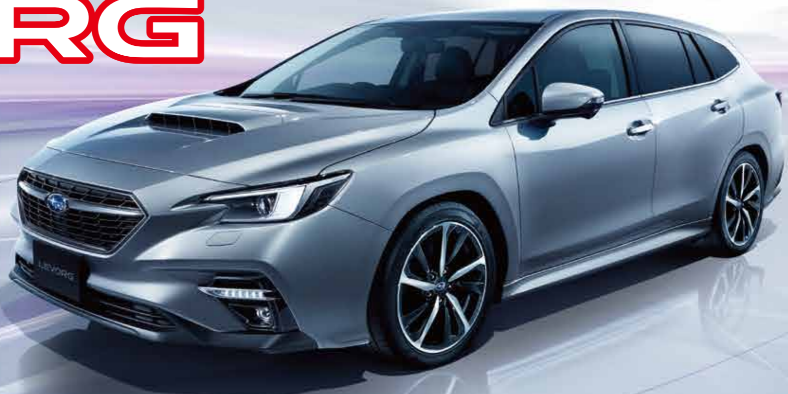
PHOTO:GT-H EX アイスシルバームetallic スマートリヤビューミラーはメーカー装着オプション。LEDアクセリアライナーはディーラー装着オプション。写真はイメージです。

レヴォーグ GT-H EX 1.8ℓ DOHC 直噴ターボ“DIT”リニアトロニックAWD (常時全輪駆動)