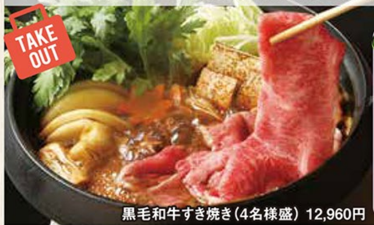
黒毛和牛すき焼き(4名様盛) 12,960円