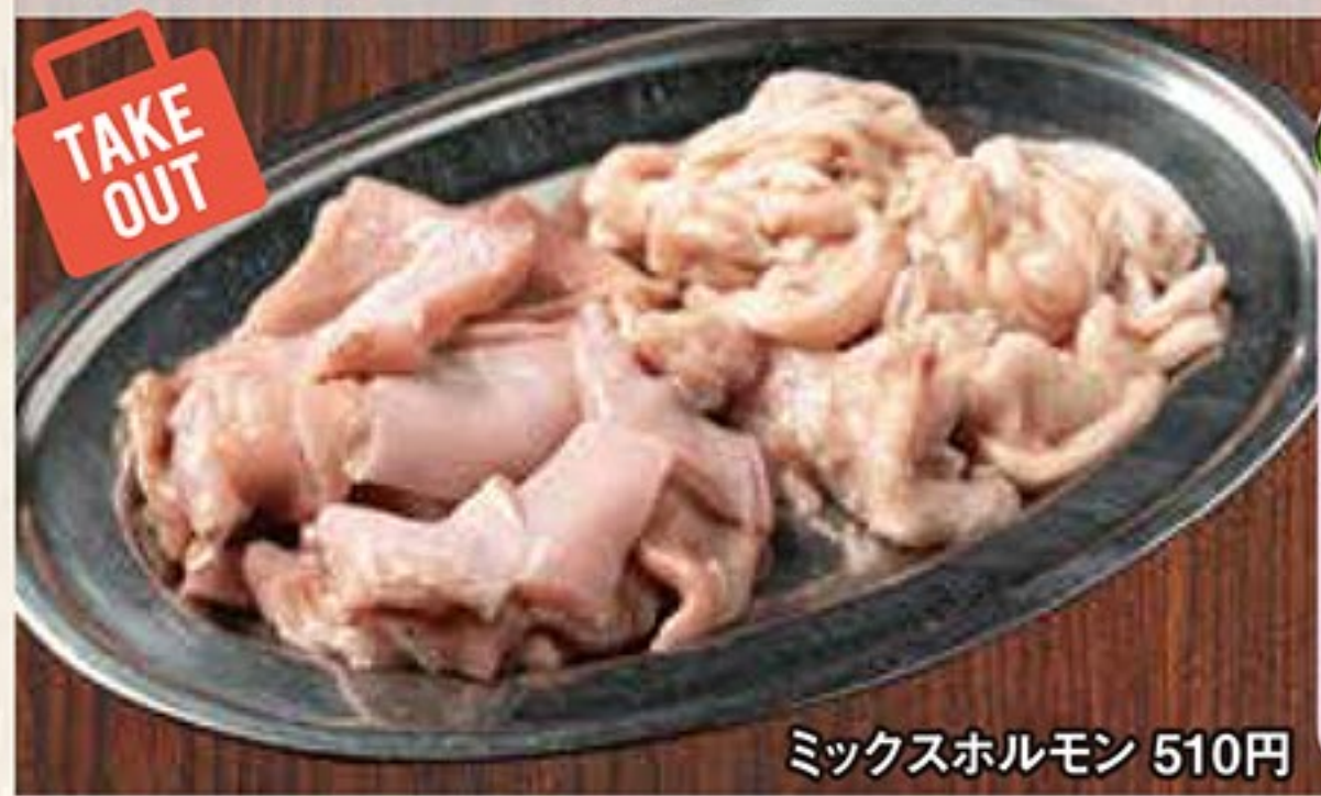
ミックスホルモン 510円