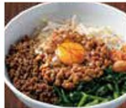
なっとうビビンバ 780円