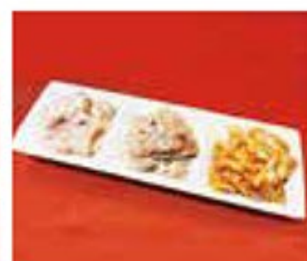
ホルモン3種盛り 990円