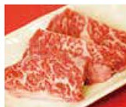
厚切り上サガリ 1,380円