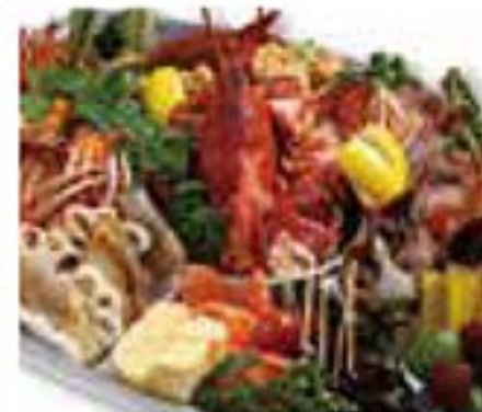
特製オードブル(4名様盛) 8,800円