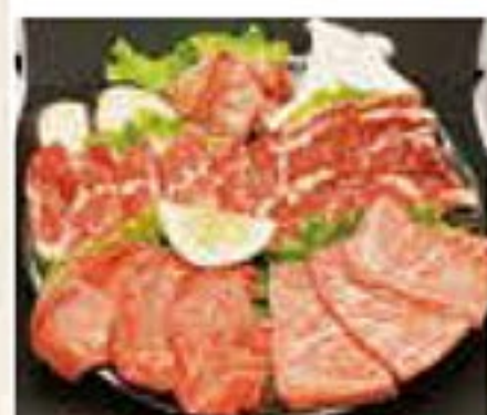
さ倉堪能コース 5,000円