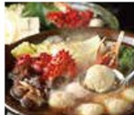
蟹つみれ鍋(4名様盛) 12,960円