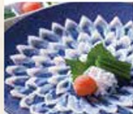
ふく刺身(4名様盛) 12,960円

今年もやってます! すき焼き、ふく料理、 蟹つみれ鍋、オード ブル等、ご予約は3 日前までお願いします。