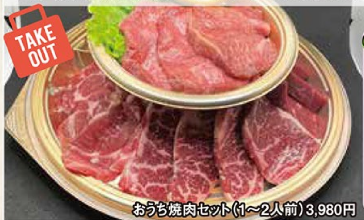
おうち焼肉セット(1~2人前) 3,980円