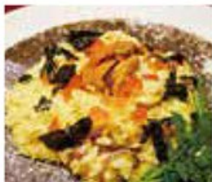
ウニクリームリゾット 1,500円