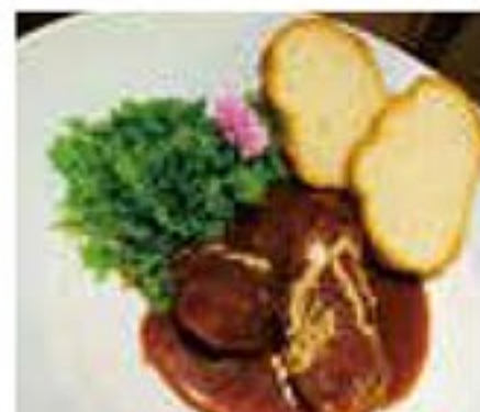
牛タン下のデミグラスソース煮 1,400円

掲載メニューの他にも 単品メニューのテイクアウトが出来ます のでお気軽にお店へご連絡ください。