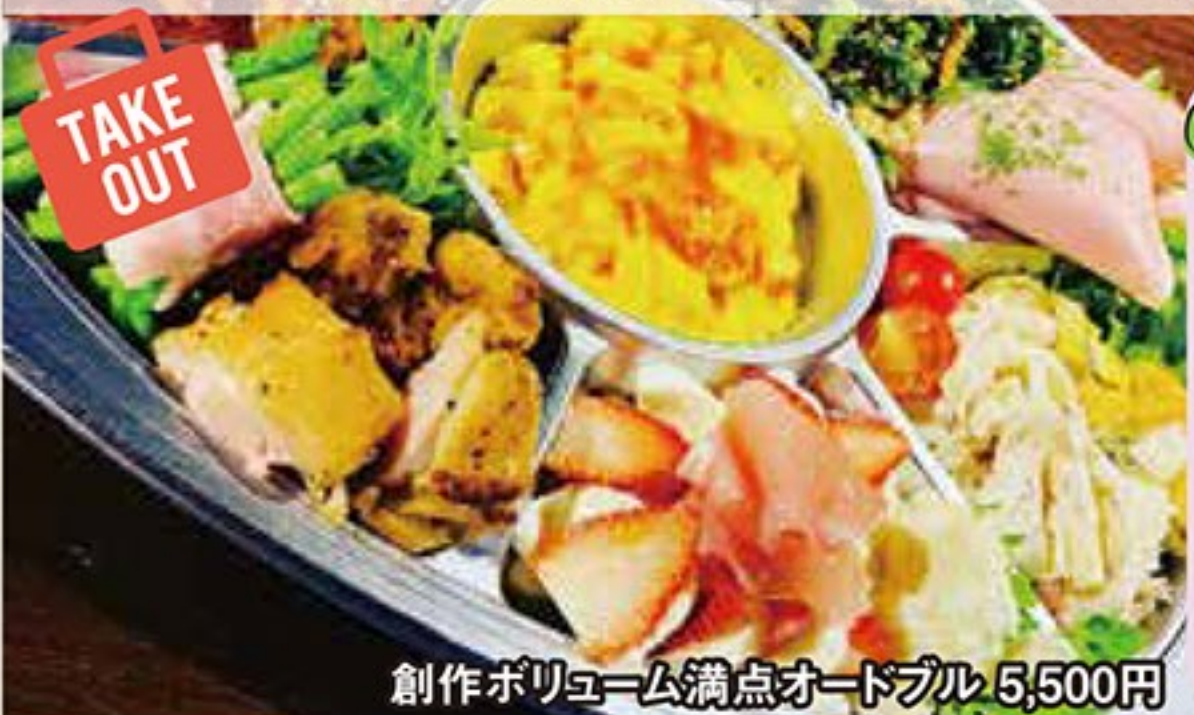
創作ボリューム満点オードブル 5,500円