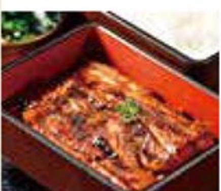
うな重 4,104円 (うな丼 3,024円)