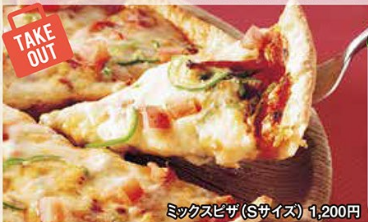
ミックスピザ(Sサイズ) 1,200円