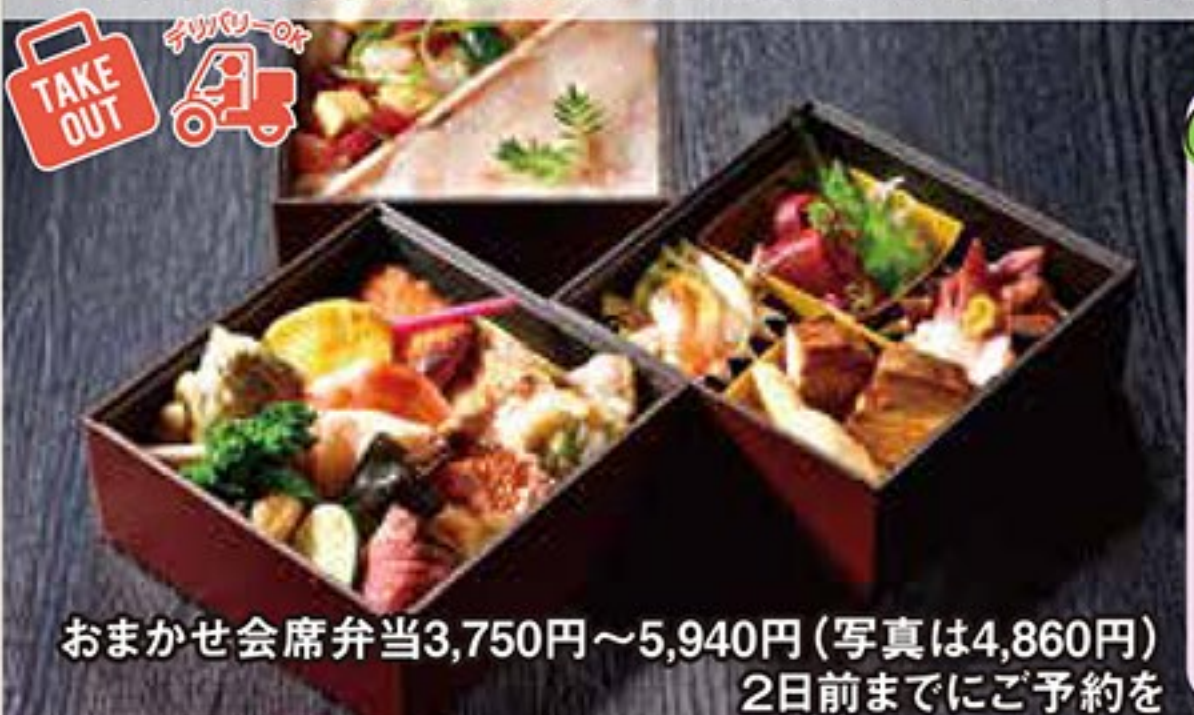
おまかせ会席弁当3,750円~5,940円(写真は4,860円) 2日前までにご予約を