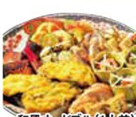
和風オードブル(1人前) 2,160円※写真は3人盛り 2日前までにご予約を

このほか、生かし、手巻き寿司、お鍋セットなど もございます。 ※お弁当・オードブル・お鍋セットは2日前まで にご予約下さい。 ※出前は当店より半径約6km以内となります。 ※出前は5,000円(税別)以上のご注文より承 ります。 ※メニューにより容器代もしくは出前料が別途 かかります。 詳しくはご注文の際にお確かめください。