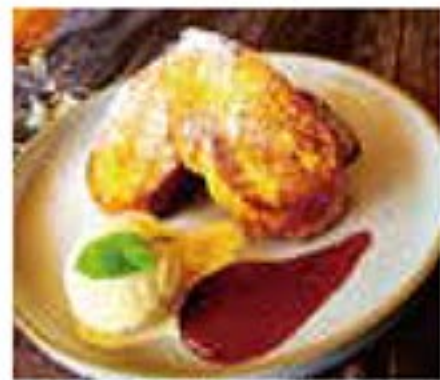
フレンチトースト(アイス添え) 650円