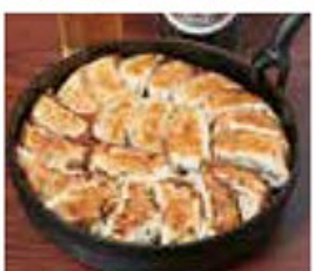
鉄鍋円盤餃子(20個) (テイクアウト) 1,500円