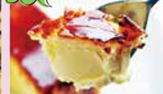
特製デザート 1品サービス