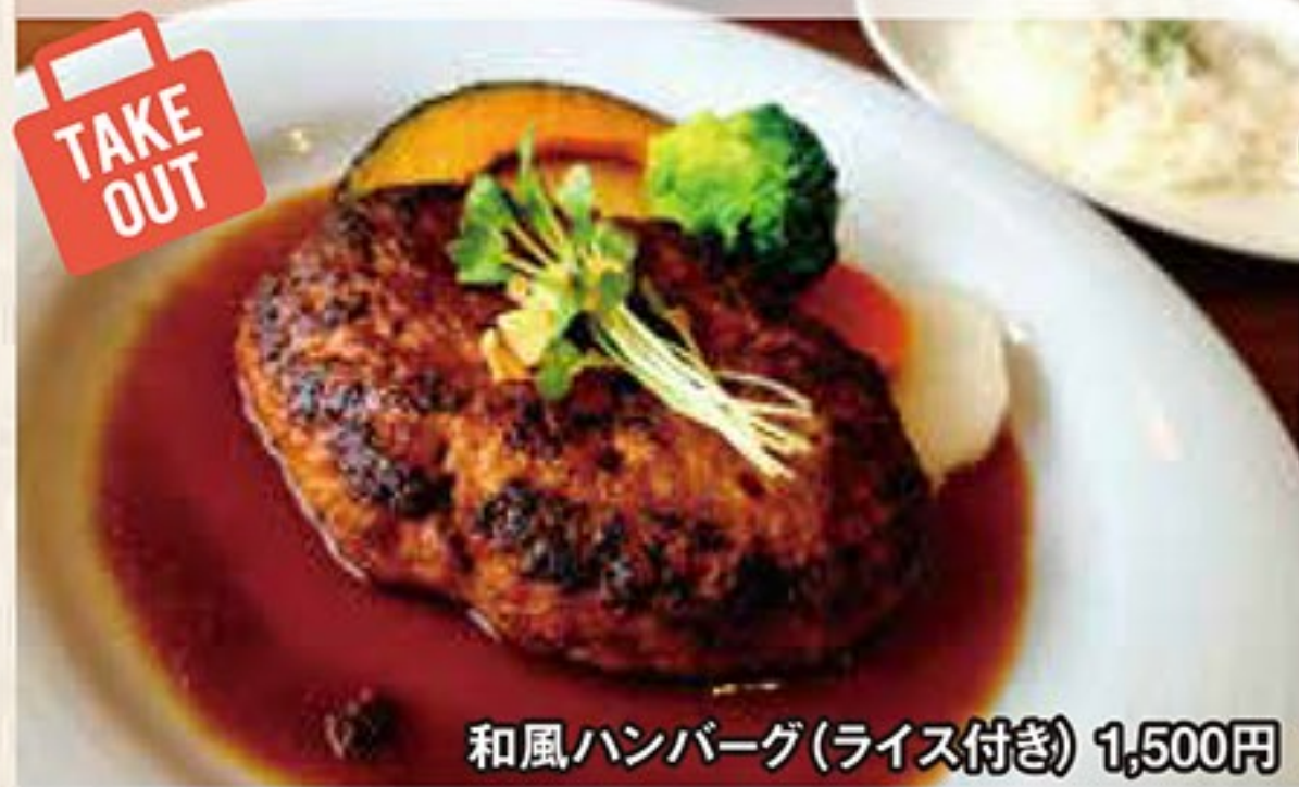
和風ハンバーグ(ライス付き) 1,500円