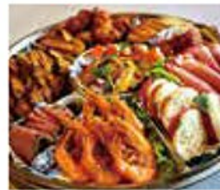
X'mas&年末オードブル 4,500円・7,000円