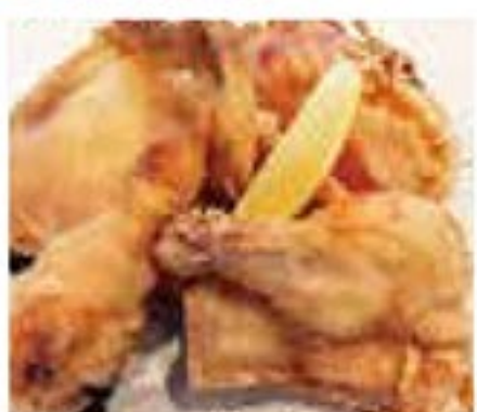
若鶏の半身揚げ (テイクアウト) 750円

●その他 テイクアウトメニュー ・パーティー円盤餃子 (20個) 1,500円 ・チャーハン 620円