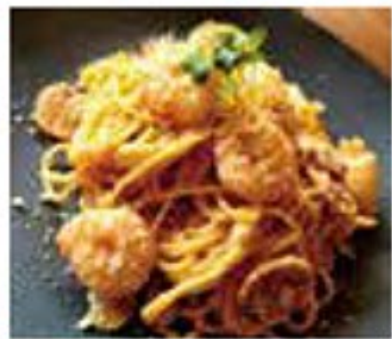
タラコと海老のクリームパスタ 1,200円