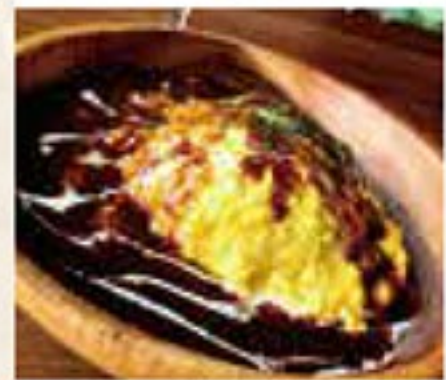
とろとろ半熟オムライス 990円