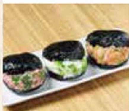
寿司トツォ 1個 350円