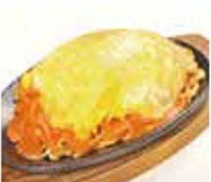
ピカタ (折代込み) 1,000円