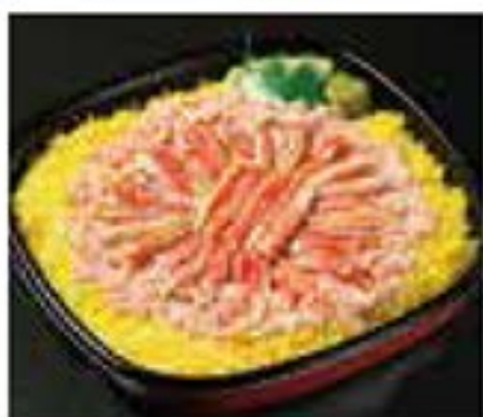
かに三味(直径約25cm・3~4人前) 5,900円

クリスマスや年末年始にピッタリの「かに三味」はご利用の7日前までにご予約ください。