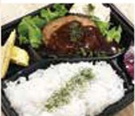
手づくりハンバーグ弁当 900円

みたよ!特典 800円以上のご注文一品につき お茶1本サービス ※デリバリー・テイクアウトのお客様に限ります。