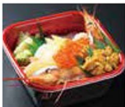
特鮮海鮮丼(並盛) 1,500円