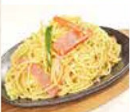
泉屋風 (折代込み) 970円