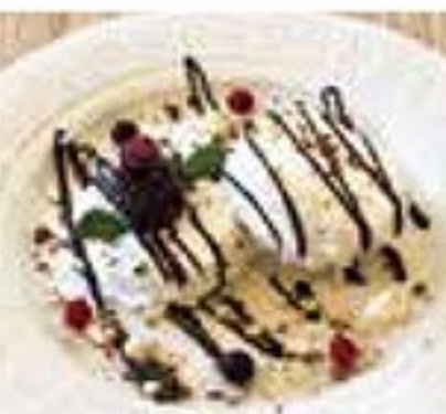
ビスケットケーキ 650円