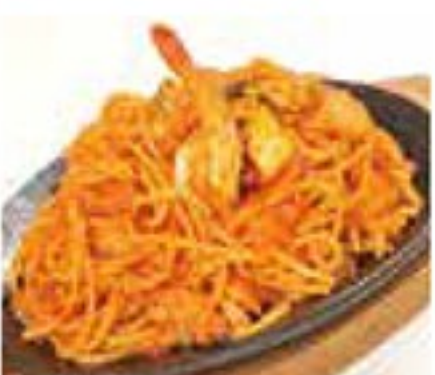
海の幸スパゲティ (折代込み) 1,180円