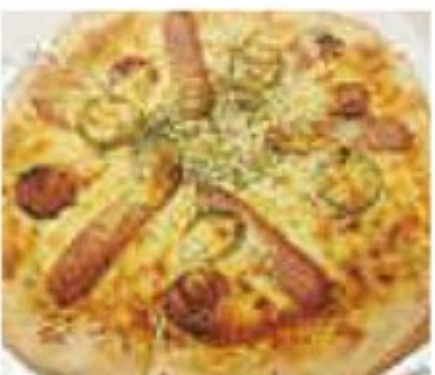
ウインナーサラミピザ 1,050円