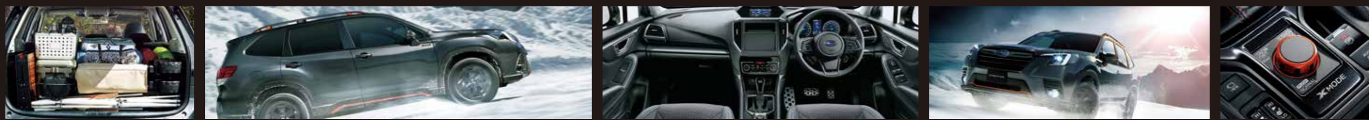
PHOTO:Advance クリスタルホワイトパール(33,000円高・消費税10%) ルーフレール(ローホール付)、アイサイトセーフティプラス(視界拡張)はメーカー装着オプション 写真はイメージです。

Advance 2.0L DOHC 直噴+モーター (e-BOXER) リニアトロニック AWD (常時全輪駆動)