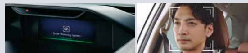
インパネセンターバイザーに内蔵されたカメラによる認識イメージ

標準装備 Advance SPORT メーカー装着オプション Touring X-BREAK