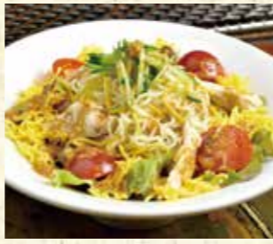
ラーメンサラダ 660円

セルフスタイルの炉端焼きが楽しめる本格炭火焼きレストラン「かばた 煉瓦」。炉端焼きだけでなく、居酒屋メニューも充実しています。中でもイチオシは4月から始まった新メニュー「鮭のハンバーグ チーズソースがけ」。栄養豊富な鮭をふんだんに使用したジューシーなハンバーグで、道産ミルクと2種類のチーズを使用したソースとの相性は抜群!お子様にも大人気です!同じく新メニューの「ラーメンサラダ」は地元製麺会社「道東製めん」の麺を使用。茹でた麺にパリパリの揚げ麺が混じり、香ばしい食感が楽しめます。当店のこだわりが詰まったさまざまな素材の味を存分にお楽しみください。