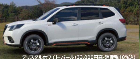
クリスタルホワイト・パール (33,000円高・消費税10%込)