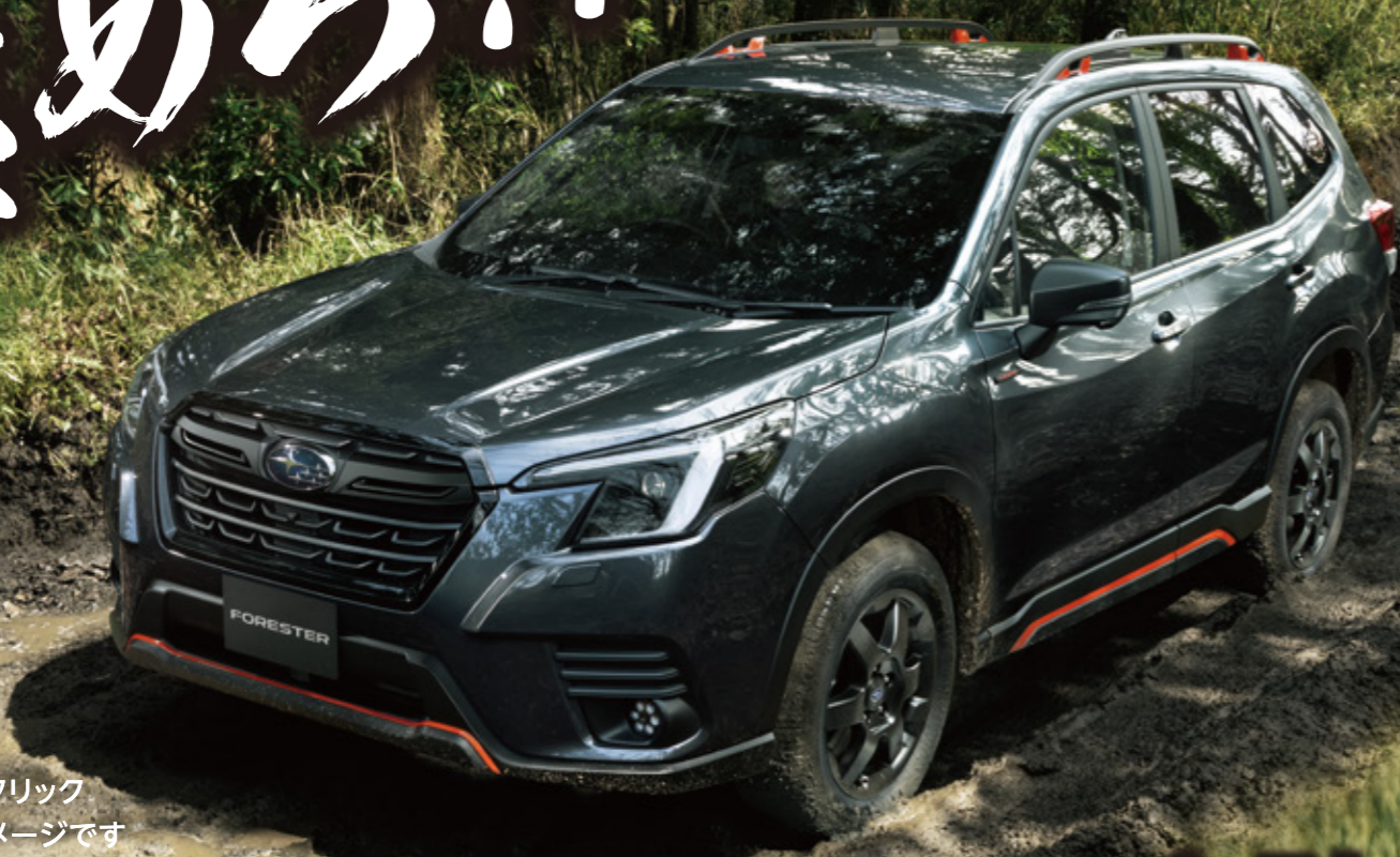
マグネタイトグレー・メタリック ※画像は合成によるイメージです

※本車両はフォレスター X-Breakをベースに釧路スバルが独自に用品をチョイスし装備した限定商品となります。