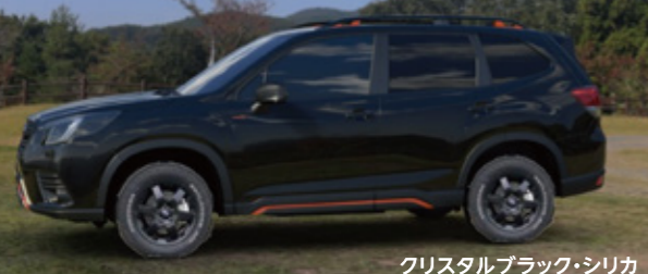
クリスタルブラック・シリカ