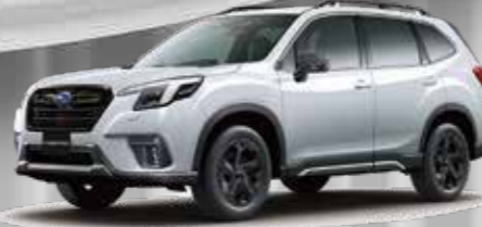
FORESTER XT-EDITION クリスタルホワイトパール