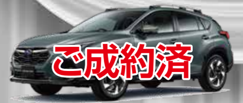
CROSSTREK Limited オファショアブルーメタリック