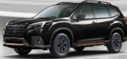
FORESTER X-BREAK クリスタルブラック・シリカ