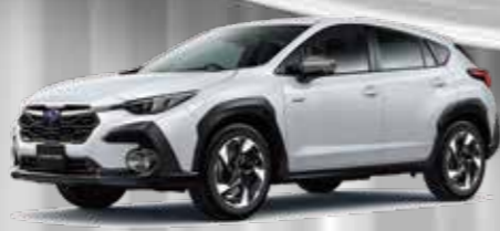
CROSSTREK Limited クリスタルホワイトパール