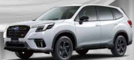
FORESTER STI SPORT クリスタルホワイトパール